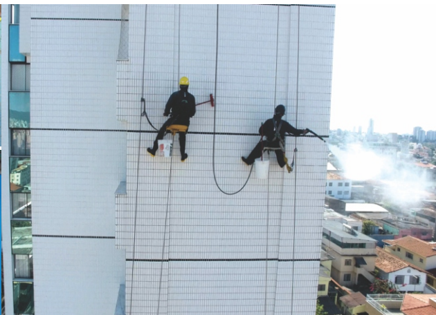
Limpeza e hidrofugação de fachadas