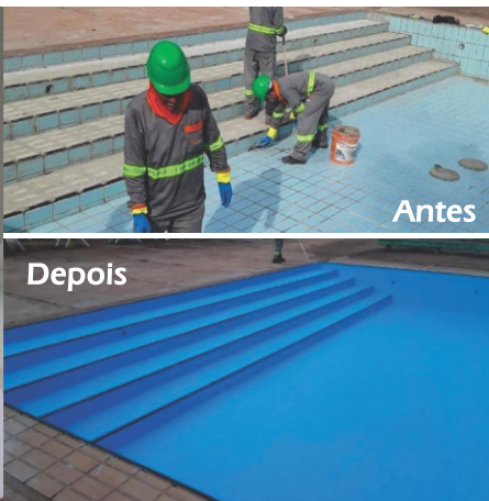
Impermeabilização com Everlast diretamente sobre azulejo