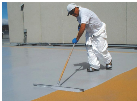
Facilidade na aplicação

Intervenção prática, rápida e limpa evitando desconforto e transtornos sem interromper a utilização das áreas comuns do condomínio.