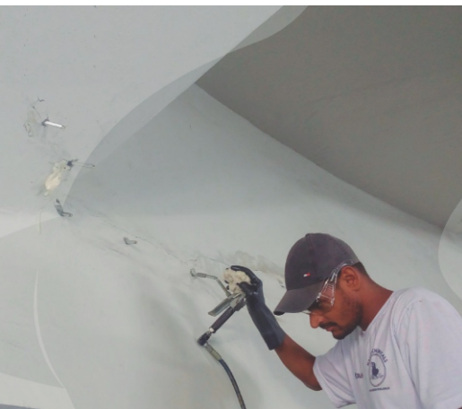
Impermeabilização com injeção de gelpolímeros em vigas e laje