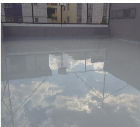
Laje impermeabilizada com Everlast

Desnecessário esvaziar piscinas ou reservatórios para a impermeabilização.